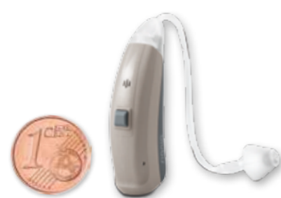
Original Größenvergleich zwischen einem Cent und dem SIEMENS Prompt S Hörgerät

Eine individuelle Beratung und Anpassung, kostenloses Probetragen von bis zu 70 Tagen und viele weitere Extras gibt es gratis dazu!