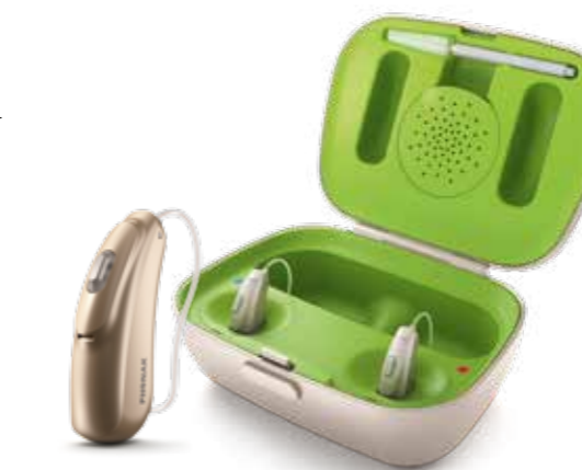
Hörgeräte von Phonak - Größe kann je nach Modell variieren

„Ich wollte einfach ein Hörgerät, das ich auch wirklich trage“, sagt Gisela Egidius heute sehr überzeugt. Allein aus dem Bekanntenkreis kenne sie Beispiele, bei denen das vorhandene Hörgerät nicht oder nur selten zum Einsatz komme. Eine gute Passform und vor allem die einfache Bedienung des Gerätes seien für sie die wichtigsten Voraussetzungen zur Entscheidung für ein Hörgerät gewesen. Ihr neues Gerät macht es ihr einfach: Nur ein Handgriff beim morgendlichen Einsetzen und sie weiß, ob ihr neues Hörgerät ist die Stromversorgung über leistungsfähige Lithium-Ionen-Akkus. Vor dem Schlafengehen steckt sie ihre Hörgeräte in eine Ladestation und am Morgen sind die beiden Hörhilfen wieder vollständig einsatzbereit. „Nach den Angaben des Herstellers hält die Leistung des Hörgerätes bei voller Ladung über einen Zeitraum von 24 Stunden an“, erklärt Hörgeräteakustiker Malte Fixson.